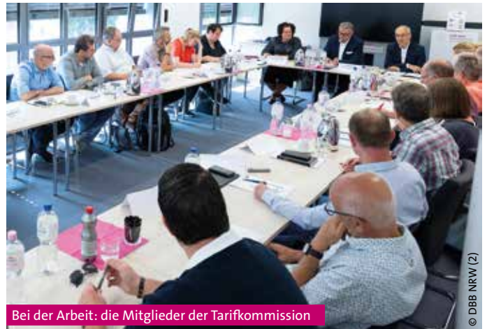
Bei der Arbeit: die Mitglieder der Tarifkommission

Außerdem wurde die zurückliegende Tarifrunde Bund und Kommunen (TVöD) bewertet. ■